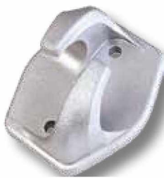
Anclaje intermedio A20.