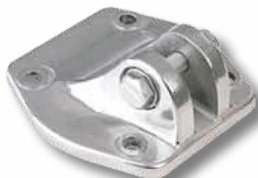
Anclaje extremidad A10.