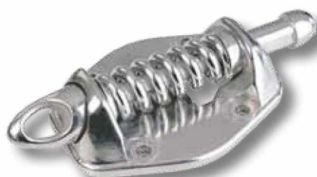
Amortiguador inoxidable X30.